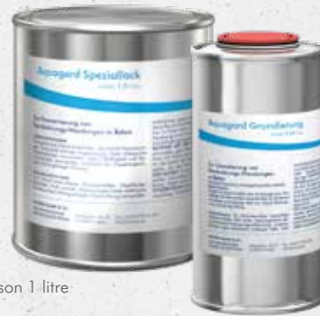
Taille de livraison 1 litre